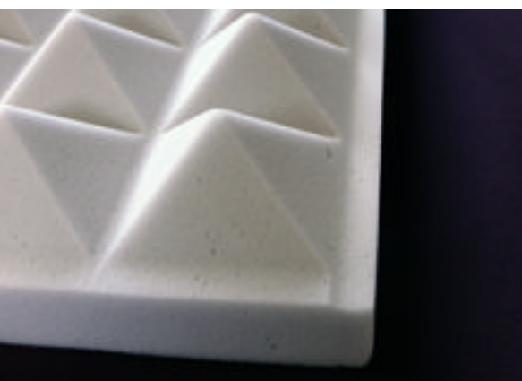
Leverbaar met rand voor plafondsysteem