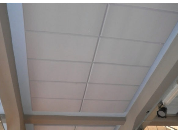
Plafond Kinderziekenhuis Kikonia